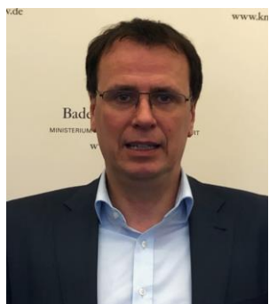
Staatssekretär und Mitglied des Landtages Volker Schebesta MDL