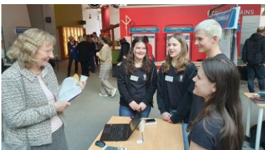
Schüler*innen präsentieren der Vertreterin des RP Freiburgs ihr Projekt

Neben den Vorträgen hatten die Schülergruppen die Möglichkeiten ihre Projekte auf dem Marktplatz der Möglichkeiten zu präsentieren. Insgesamt stellten die Schüler ihre Projekte an über 33 Ständen vor. Neben anschaulichen Postern hatten die Schüler tolles Anschauungsmaterial mitgebracht, dass sie stolz den Teilnehmern erläuterten. Zusätzlich zu den 145 Schülerinnen und Schüler inklusive Lehrpersonen, die zweitägig am Kongress teilnahmen, besuchten an beiden Kongresstagen weitere Tagesgäste aus den beteiligten Schulbehörden und von der Presse den Kongress. Diese Schüler nutzten die Gelegenheit sich über die Projekte zu informieren, um daraus eigene Projektideen für ihren Unterricht zu entwickeln. Aus dem Regierungsbezirk Freiburg präsentierten Schülergruppen aus Breisach am Rhein, Freiburg, Kirchzarten, Lahr, Renchen, Rottweil und Lörrach ihre Projekte. Einen Überblick über alle Teilnehmenden Schulen ist unter www.biovalley-college.net zu finden.