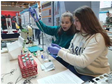
Schülerinnen beim Präsentieren auf dem Marktplatz