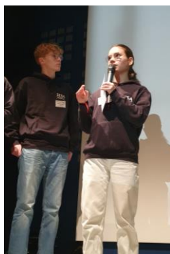
Schülerin beim Vortrag

Insgesamt hatten sechs Schülergruppen die Möglichkeit ihre Projekte im Rahmen einer Präsentation im Auditorium vorzustellen. Dabei faszinierte insbesondere die Fähigkeit der Schüler ihre Projekte einerseits spannend als auch verständlich in den beiden Kongresssprachen Deutsch und Französisch zu vermitteln. Den Anfang machten Schülerinnen und Schüler Ludwig-Uhland-Gymnasium – Kirchheim/Teck, die ihre selbstgebaute und programmierte, solarbetriebene Wetterstation vorstellten. Die Schülerinnen und Schüler des Gymnasiums Kirschgarten in Basel berichteten über ihre Projekte zu „Insekten: Die Lösung unseres Plastikproblems?“ und „Welche Plastiktüte würdest Du verwenden?“ über etwaige Lösungskonzepte in diesem Bereich. Weitere Vorträge kamen von Schülerinnen und Schülern vom Lycée Albert Schweitzer in Mulhouse, von der Grimmelshausenschule in Renchen, vom Marie-Curie-Gymnasium Kirchzarten bzw. Freiburg-Seminar und vom Lycée Lambert in Mulhouse. Die binationale Schülergruppe vom Helmholtz-Gymnasium in Karlsruhe und vom Lycée Théodore-Deck in Guebwiller stellten ihr gemeinsames Projekt zur vergleichenden Analyse der chemisch-physikalischen Eigenschaften des Wassers des deutschen Alb-Bachs und des französischen Lauch-Bachs vor.